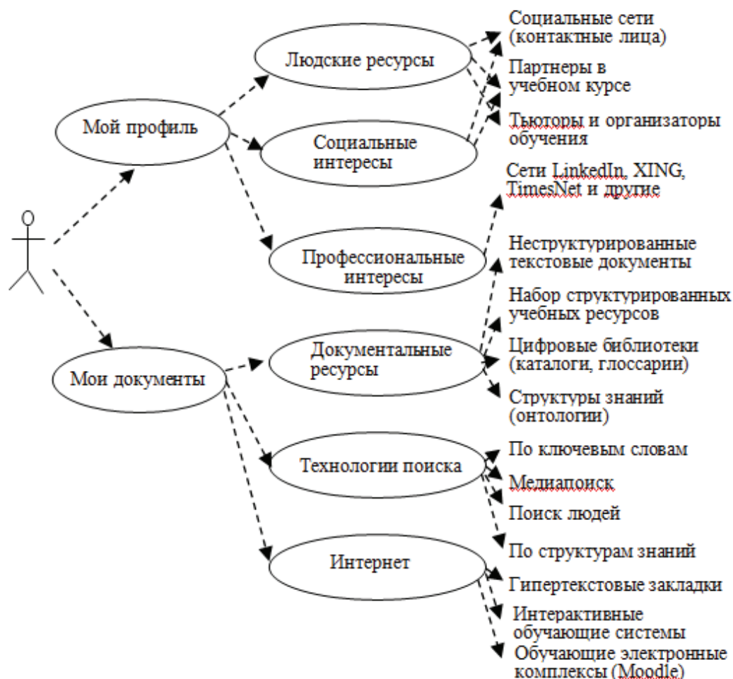
Рис. Схема персонального пространства знаний

Понятно, что к взаимодействию между разнородными (гетерогенными) средами и услугами следует привлечь семантические средства. Недавние исследования показали, что целесообразно использовать онтологии для определения характеристик социальных ресурсов и индивидуальных образовательных сред [16]. Онтология может стать уникальной формализацией предметной области [14]. В разных странах уже разработаны онтологии для ряда предметных областей.