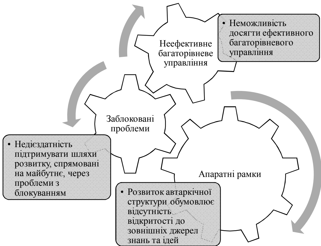
Рис.1. Основні проблеми регіональної інноваційної політики.

Неможливість досягти ефективного багаторівневого управління пов'язаного зі слабким інформаційним обміном між рівнями уряду, відсутністю спроможності на субнаціональному рівні розробляти та проводити політику, недостатності фінансових ресурсів для деяких регіонів (ОТГ), нездатності вирішувати проблему розповсюдження програм, що походять з різних рівнів, та прогалин у розподілі обов'язків є ключовими причинами неефективного багаторівневого управління.