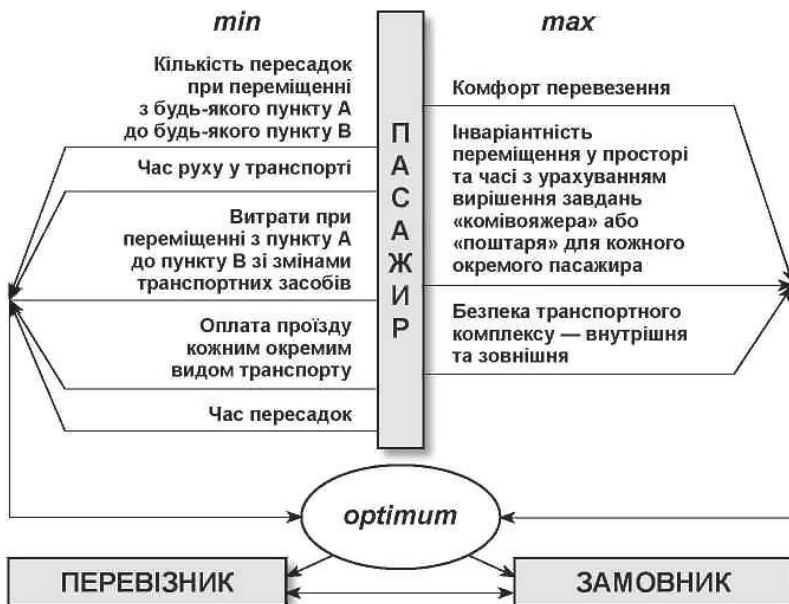
Рис. 10.8. Головні зв'язкові функції елемента «пасажир» у системі транспортних перевезень

Головні зв'язкові функції перевізника зображені на рис. 10.9.