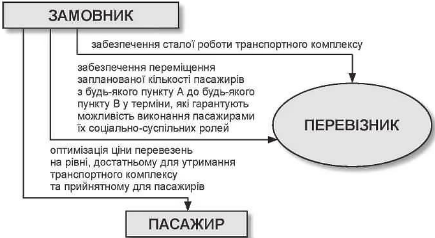
Рис. 10.7. Головні зв'язкові функції елемента «замовник» у системі транспортних перевезень

Слід відзначити, що елемент «замовник» у системі транспортних перевезень є особливим елементом, оскільки його зв'язки у системі не спрямовані на «мінімізацію» або «максимізацію» і формулюються лише за критеріями оптимізації. Схематично вони представлені на рис. 10.7.