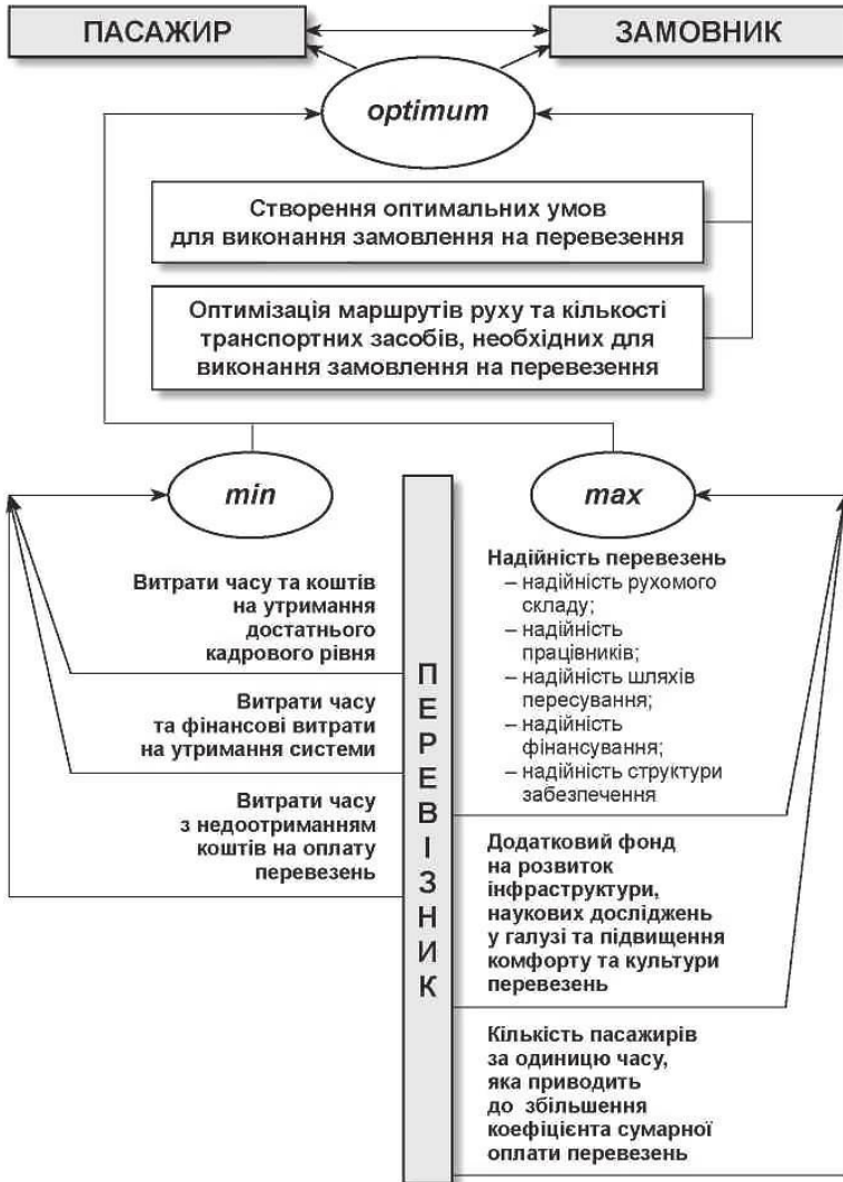
Рис. 10.9. Головні зв'язкові функції елемента «перевізник» у системі транспортних перевезень