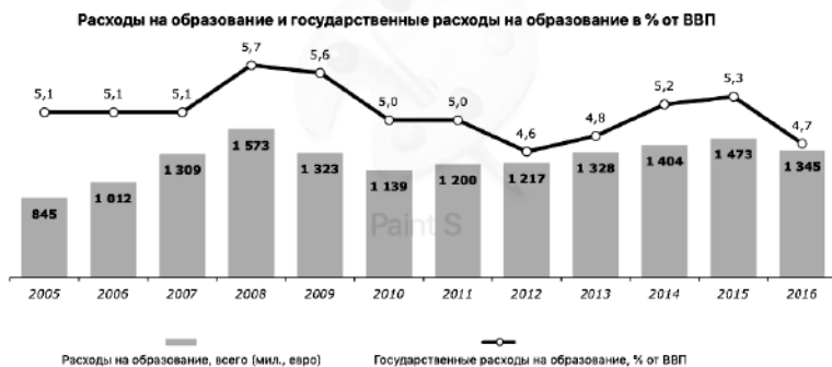
Рис. 2 Динамика инвестиций в образование [6]

12 и 13 марта 2019 года в Брюсселе состоялась встреча рабочей группы Европейской комиссии по образованию взрослых, основной целью которой была разработка идей о возможном направлении политики непрерывного образования в Евросоюзе после 2020 года. В презентации Еврокомиссии был также проведен анализ уже реализованного и прозвучали главные выводы, один из которых звучит так: показатели взрослого населения, вовлеченного в непрерывное образование ниже, чем были обозначены в целях для стран-участников Болонского процесса. Рабочая группа подтвердила, что проблемы похожи во всех странах. Например, в Латвии необходимо увеличить мотивацию участников непрерывного образования, особенно среди малоквалифицированных жителей. Похожая ситуация и в Швеции, где много малоквалифицированных работников. По мнению рабочей группы, на данный момент в странах-участницах в сфере образования большее внимание уделяется высшему и профессиональному образованию, а не образованию взрослых. [1]