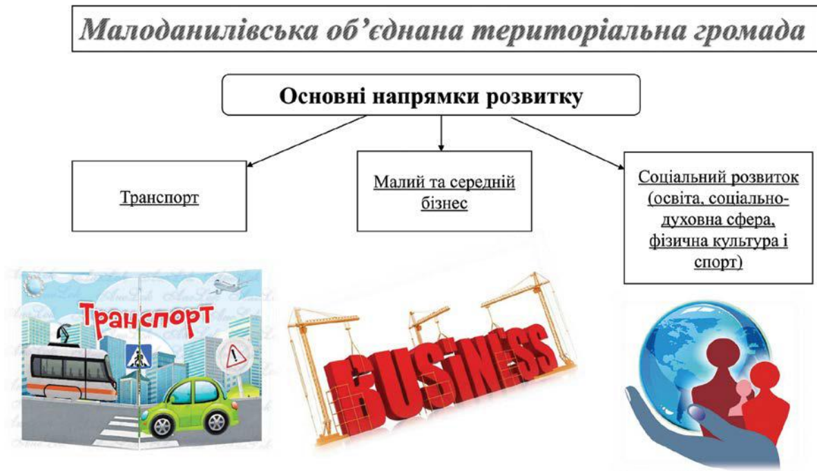
Таблиця 13. Критерії напрямків розвитку Малоданилівської селищної об'єднаної територіальної громади