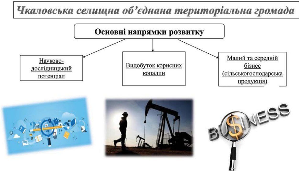
Таблиця 17. Критерії напрямків розвитку Чкаловської селищної об'єднаної територіальної громади