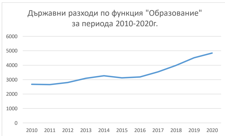
Фиг.2 Структура на разходи по функции „Образование” в Консолидираната фискална програма на Р България за периода 2010 - 2020г

Изследването на разходите за образование в периода 2010-2020 г. позволява заключението, че номиналната им стойност е сравнително постоянна, относителният им дял в структурата на общите разходи се запазва константа – 9 до 11%. Разходите за образование запазват постоянен дял и от БВП, с 3,5 - 4 % от неговата стойност. През 2010 г. 2.678,2 млн. лв. са разпределени в направление